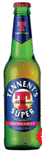
BIRRA TENNENT'S SUPER ML 355