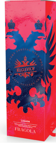
VODKA KEGLEVICH FRAGOLA ML 700