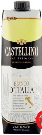
CASTELLINO BIANCO BRIK ML 1000