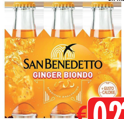
APE SAN BENEDETTO GINGER BIONDO 6x ML 100