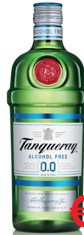
GIN TANQUERAY ANALCOL 0.0 ML 700