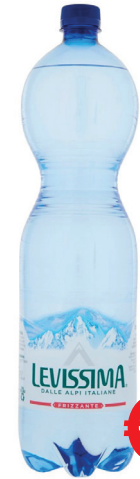
ACQUA LEVISSIMA FRIZZANTE ML 1500