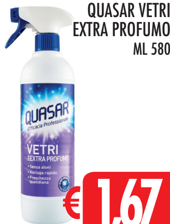
QUASAR VETRI EXTRA PROFUMO ML 580