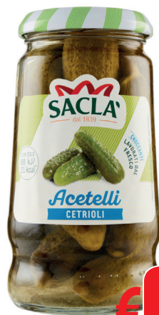
SACLA' CETRIOLINI T 314