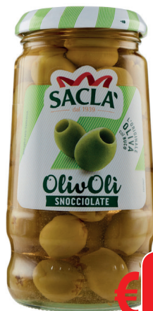
SACLA' OLIVE SNOCCIOLATE T 314