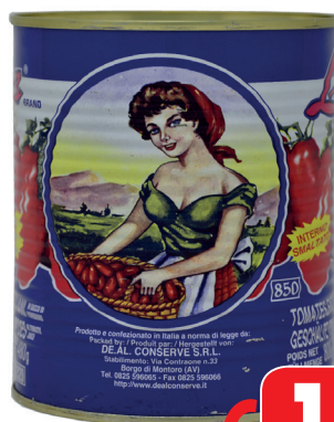
POMODORI PELATI LINA BRAND GR 800