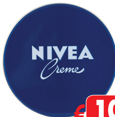
CREMA NIVEA ML 150