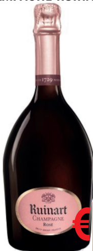
CHAMPAGNE RUINART ROSE' BRUT ML 750