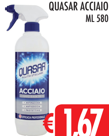
QUASAR ACCIAIO ML 580