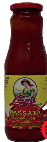
PASSATA POMODORI LINA BRAND GR 690