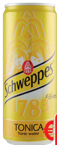
ACQUA TONICA SCHWEPES LATTINA ML 330