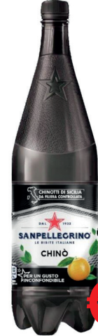
SAN PELLEGRINO CHINO' ML 1200