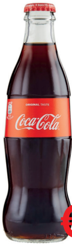
COCA COLA VETRO BOTTIGLIETTA ML 330