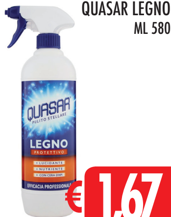
QUASAR LEGNO ML 580