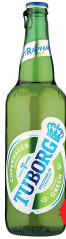
BIRRA TUBORG BOTTIGLIA ML 660