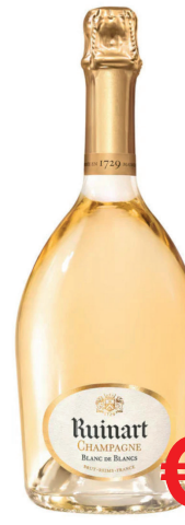
CHAMPAGNE RUINART BLANC DE BLANCS ML 750