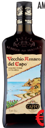
AMARO DEL CAPO ML 700