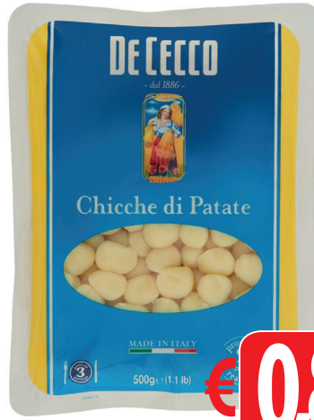
DE CECCO CHICCHE DI PATATE GR 500