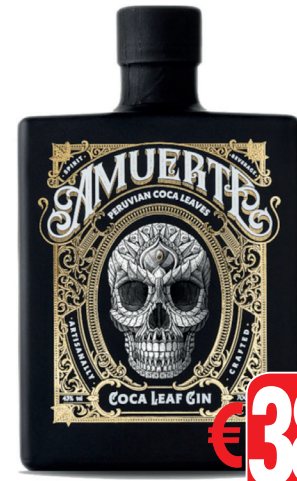
GIN AMUERTE BLACK FLAVOUR ML 700