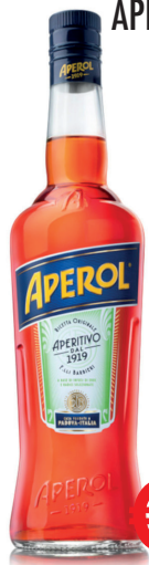
APEROL RETAIL SIZE ML 700