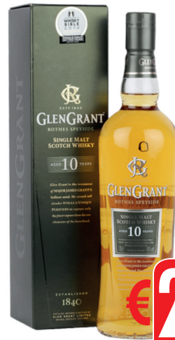
GLEN GRANT RESERVE 10A ML 700