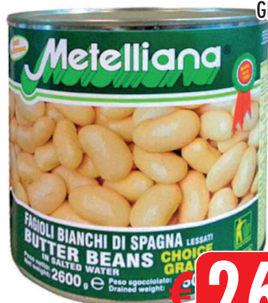
FAGIOLI BIANCHI SPAGNA GR 2500