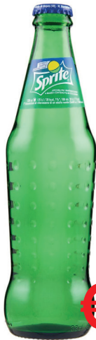
SPRITE VETRO BOTTIGLIETTA ML 330