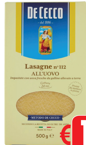
DE CECCO LASAGNE UOVO GR 500