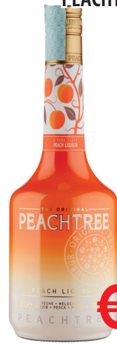
PEACHTREE DE KOYPER ML 700