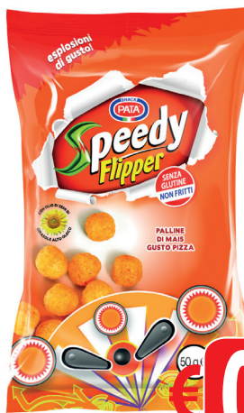
PATA SPEEDY FLIPPER PIZZA GR 50