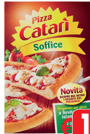
PIZZA CATARI' SOFFICE GR 440