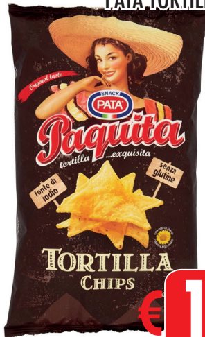
PATA TORTILLA SALTED GR 200