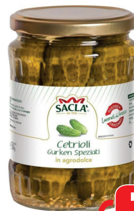
SACLA' CETRIOLINI GURKEN GR 1000