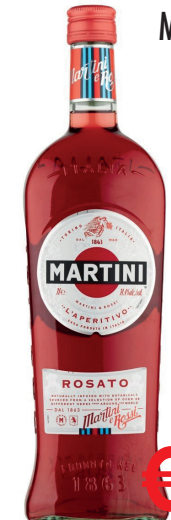
MARTINI ROSATO ML 1000