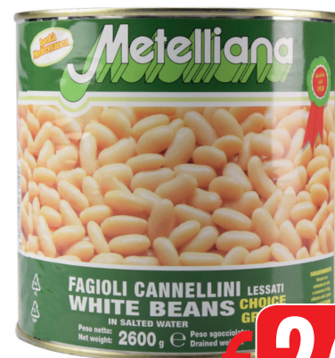
FAGIOLI CANNELLINI LATTA GR 2500