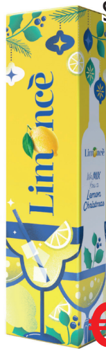
STOCK LIMONCE' ML 500