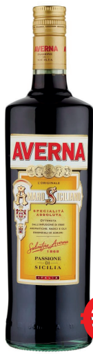
AMARO AVERNA ML 1000