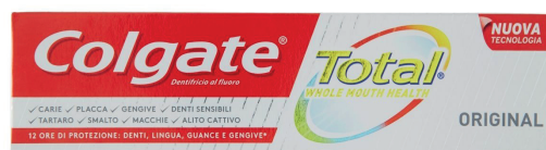
DENTIFRICIO COLGATE TOTAL ORIGINAL ML 75