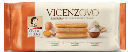
VICENZI SAVOIARDI GR 300