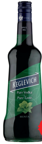
VODKA KEGLEVICH MENTA ML 700