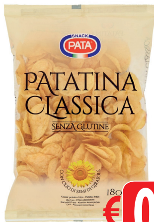
PATA CLASSICA GR 180