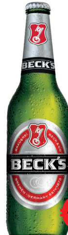
BIRRA BECK'S BOTTIGLIA ML 600