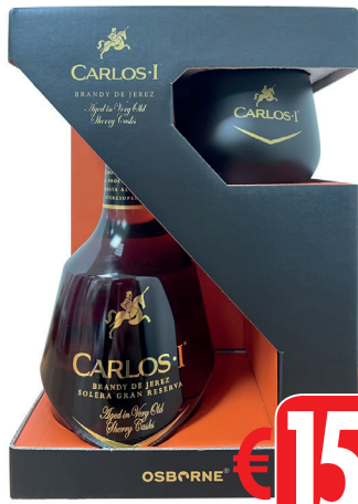
BRANDY CARLOS ASTUCCIO ML 700