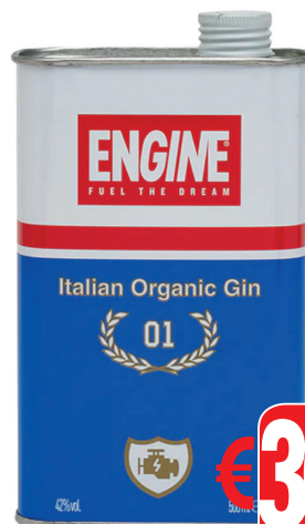
GIN ENGINE PURE ORGANICS ML 500