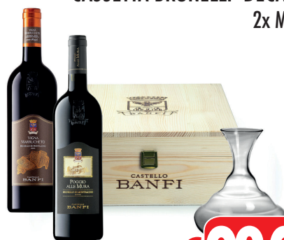
CASSETTA BRUNELLI+DECANTER 2x ML 750