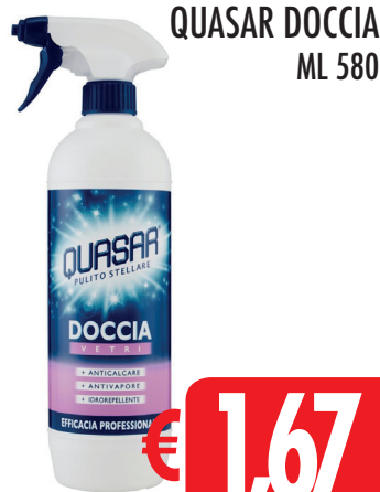
QUASAR DOCCIA ML 580