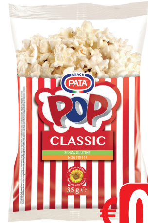
PATA POP CORN GR 35