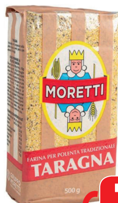
MORETTI TARAGNA GR 500