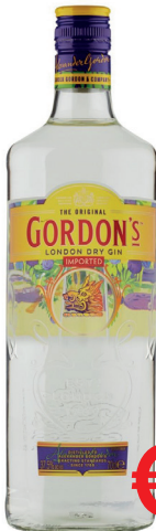
GIN GORDON'S LONDON DRY ML 700