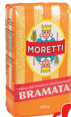
MORETTI BRAMATA ORO GR 500