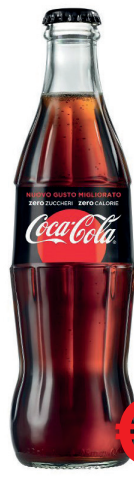
COCA COLA ZERO VETRO BOTTIGLIETTA ML 330