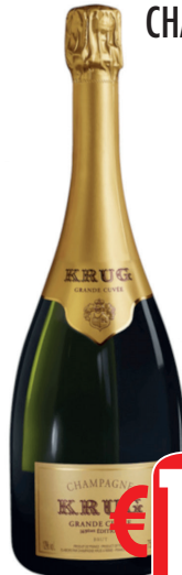
CHAMPAGNE KRUG ML 750