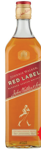
WHISKY JOHNNIE WALKER 5A ML 700