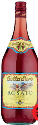
GOTTO D'ORO ROSATO ML 1500