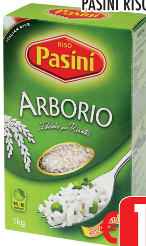
PASINI RISO ARBORIO GR 1000