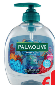
SAPONE LIQUIDO PALMOLIVE AQUARIUM ML 300