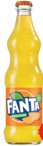
FANTA ORANGE VETRO BOTTIGLIETTA ML 330