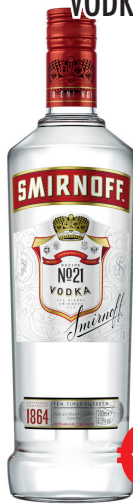
VODKA SMIRNOFF RED ML 1000