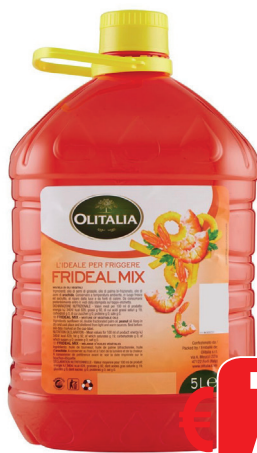
OLITALIA OLIO SEMI FRIDEAL MIX ML 5000