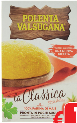
POLENTA VALSUGANA GR 370