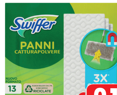
SWIFFER RICARICA 13 PANNI