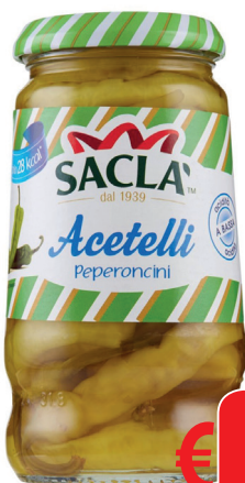
SACLA' PEPERONI LOMBARDI T 314