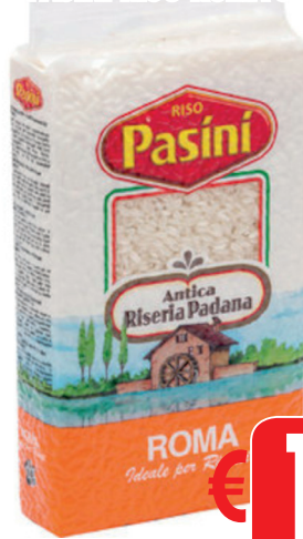
PASINI RISO ROMA SOTTOVUOTO GR 1000