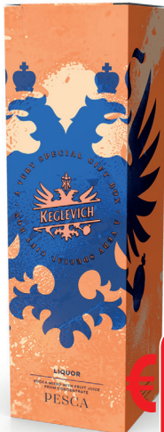
VODKA KEGLEVICH PESCA ML 700