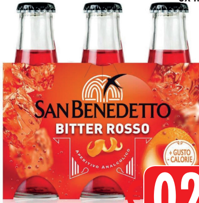
APE SAN BENEDETTO BITTER ROSSO 6x ML 100