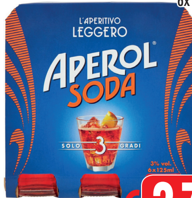
APEROL SODA CLUSTER x6 6x ML 125