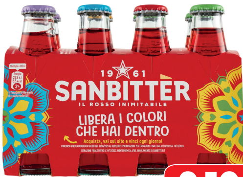
SAN BITTER x8 BOTTIGLIETTA ML 100