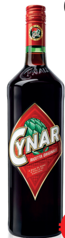
CYNAR LITRO BAR ML 1000