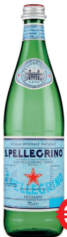
ACQUA SAN PELLEGRINO FRIZZANTE VETRO ML 750