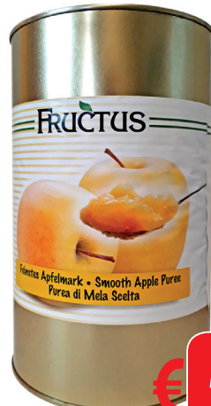
MELE PUREA SENZA ZUCCHERO GR 4650