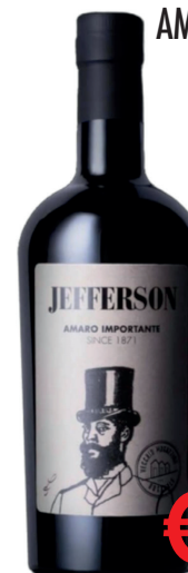
AMARO JEFFERSON ML 700