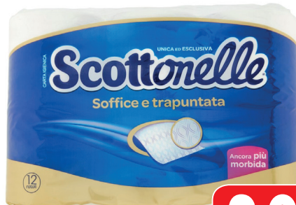
IGIENICA SCOTTONELLE FAMILIARE 12 ROTOLI