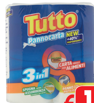
TUTTO PANNOCARTA 3in1 2 ROTOLI