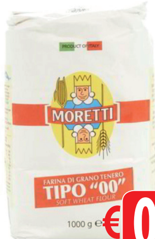
MORETTI FARINA GRANO 00 GR 1000