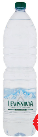
ACQUA LEVISSIMA NATURALE ML 1500