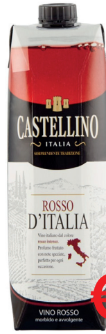
CASTELLINO ROSSO BRIK ML 1000